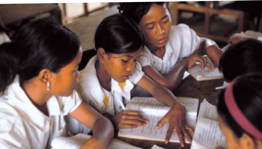
Dans les pays du Sud, la fraude fiscale des multinationales se monte à 125 milliards d'euros/an, soit 30 fois l'aide internationale à l'éducation de base.

Il faut réviser les normes comptables internationales pour exiger des multinationales qu'elles rendent compte, dans chaque pays où elles opèrent, de leurs activités, de leurs bénéfices et des impôts qu'elles paient. Certaines entreprises du secteur extractif le font déjà de manière volontaire, rien ne justifie de ne pas en faire une règle pour tous les secteurs !