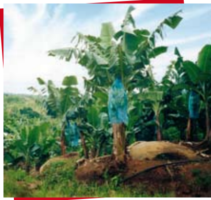
Plantation de bananiers. Haut-Penja, Cameroun.

Des montages juridiques se sont mis en place au fil du temps pour augmenter la rentabilité, le profit. Devant les résultats financiers, à Londres ou à Paris, on ferme les yeux sur les moyens, le mieux étant encore de n'avoir pas à les ouvrir ! Décryptage des mécanismes garantissant l'irresponsabilité illimitée des sociétés.