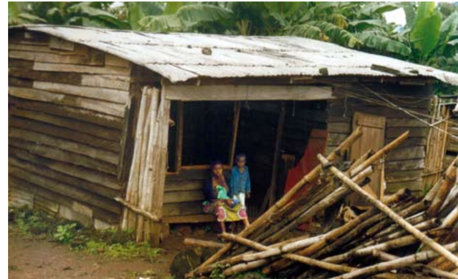
Les habitations des ouvriers sont situées à même les plantations de bananes. Haut-Penja, Cameroun.

Au Sud comme au Nord, la crise financière et économique interroge en profondeur la logique d'un système économique guidé par la finance. L'Union européenne s'est engagée à promouvoir activement le développement durable à travers le monde. Elle a le devoir de ne pas rechercher sa croissance économique aux dépens des États et des peuples du Sud, en permettant à ses sociétés de violer les droits en toute impunité. Elle a les moyens d'agir. Le marché européen est incontournable. La plupart des principales multinationales ont leur siège en Europe. Plus de la moitié des paradis fiscaux se situent en Europe ou dans ses territoires d'outre-mer. L'Europe peut imposer des règles à l'échelle internationale.